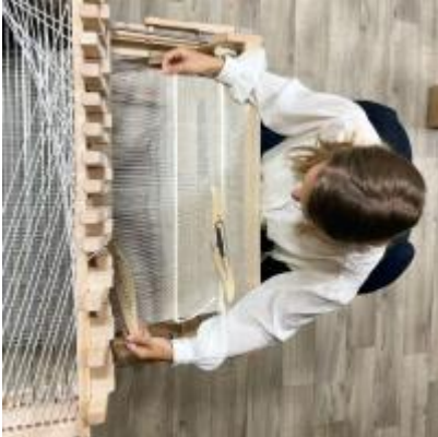
La Turbine Créative