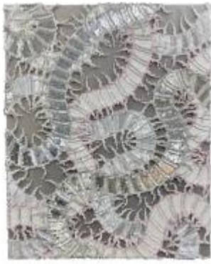
Tableau brodé Mukade