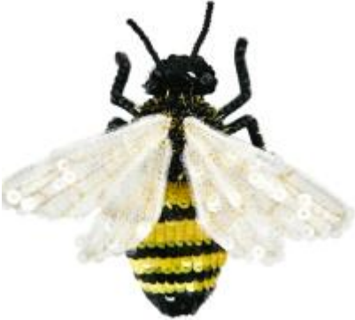
Broche brodé Abeille (Crédit : Laurent Sekimoto)