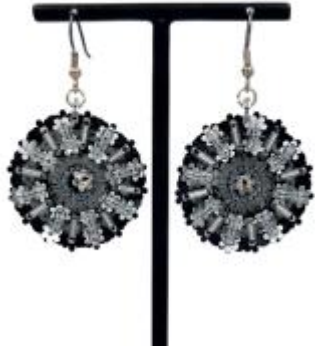
Boucles d'oreilles brodées Gilda Noir et Argent

La paire de lunettes solaires brodées "Ouvrage" issue de la collaboration Lafont x Maison Sekimoto a obtenu le prix spécial du Jury.