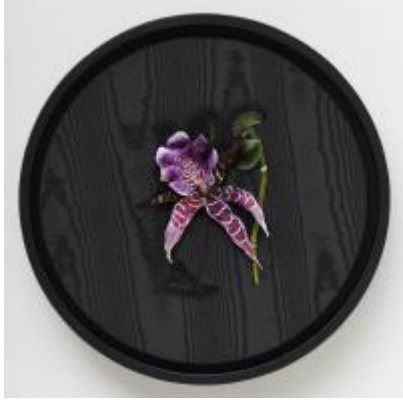
Àne et Patrick Poirier