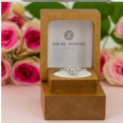
OR DU MONDE