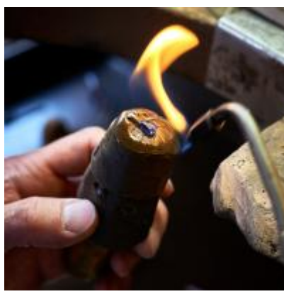
OR DU MONDE