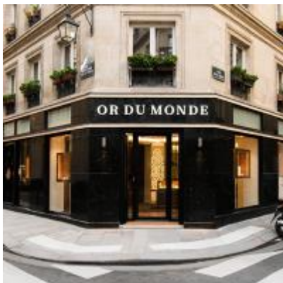
OR DU MONDE

Entreprise labellisée : Fabriqué à Paris