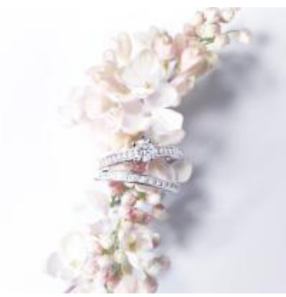
OR DU MONDE