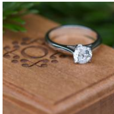
OR DU MONDE