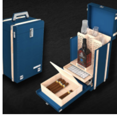
E. Leroy - Le Secret Magnifique / flickr / Shutterstock

En 1944, Jean NEISSON a été élu à la tête de la Tillerie de Neisson. Il a produit un mélange unique de plantes aromatiques locales. Les distillations sont effectuées dans un alambic traditionnel.