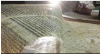
Devup région centre