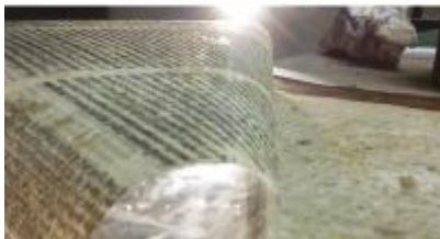
Devup région centre