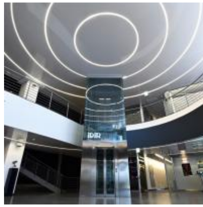
Design : Simon Norris