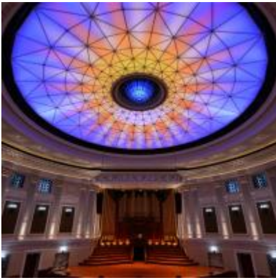
Schiappa - Design : Barbara Calvo