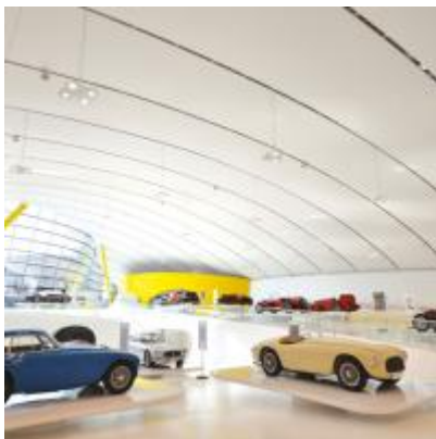
Arch. : Ian Kaplicky (Future Svstems) et Andrea Morgante

Les 1000 partenaires du réseau Barrisol® sont présents sur les 5 continents, dans plus de 145 pays. L'expérience internationale du groupe conjuguée à sa présence locale garantit un service de qualité et de proximité partout dans le monde.