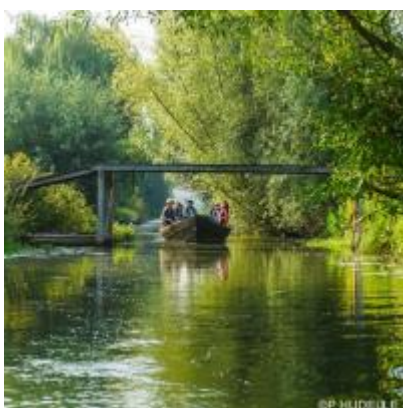
Philippe Hudelle - SPL Tourisme Saint-Omer