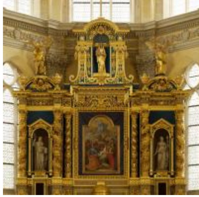
Ateliers Christophe Bénard