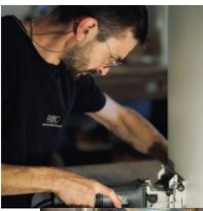
Application du Bois